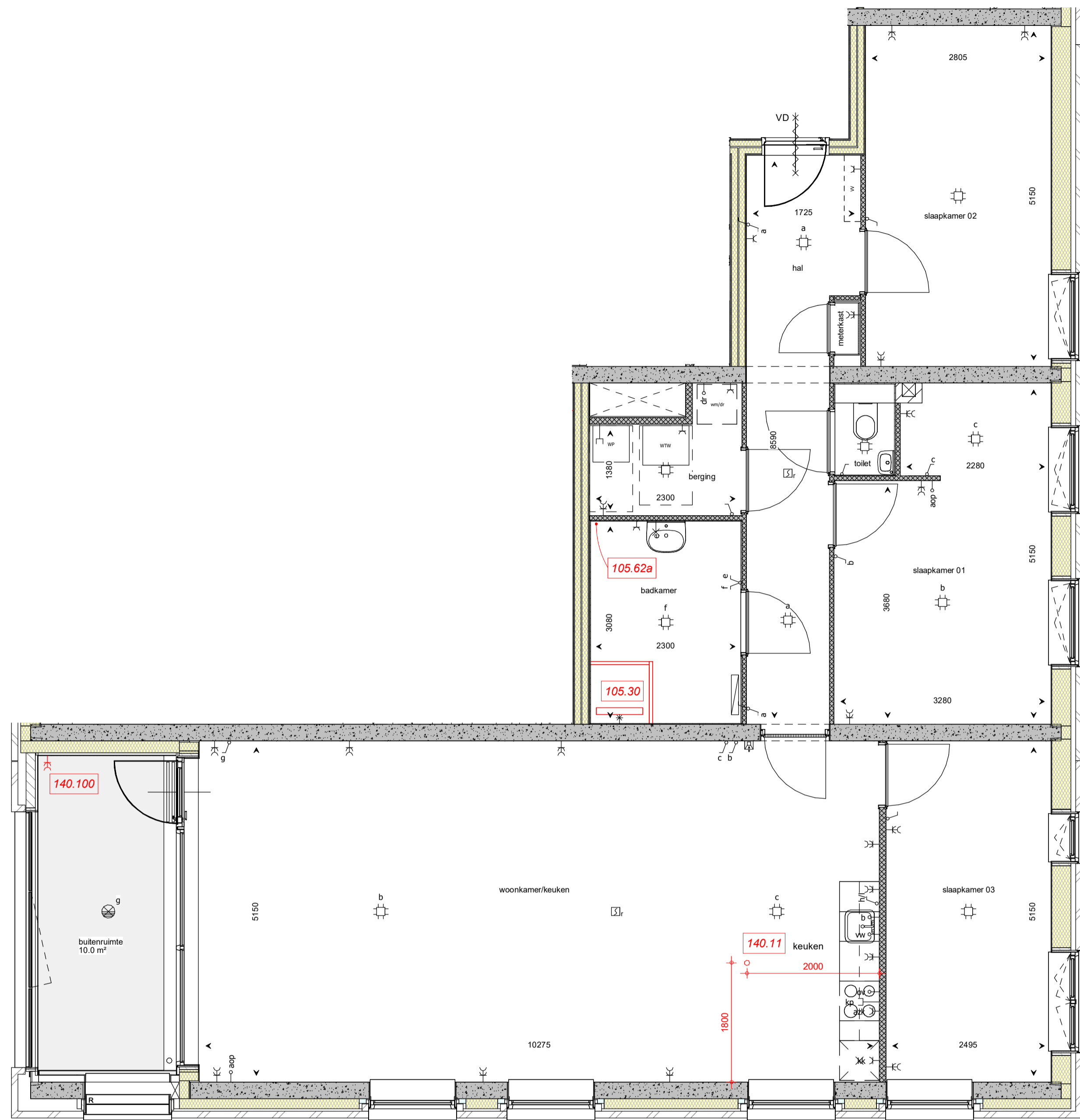
3e Verdieping, bouwnr. 39