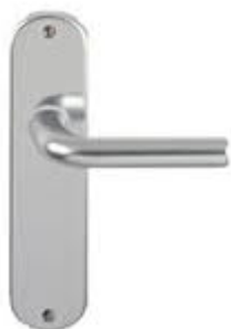
Standaard garnituur (of gelijkwaardig)