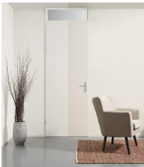
Standaard stalen binnendeurkozijn met bovenlicht opdekdeur